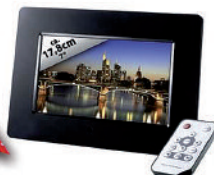
Intenso Digitaler Bilderrahmen