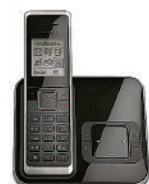
Telekom Sinus A 205

Sichern Sie sich für jedes bezahlte Neuabo mit einer Mindestlaufzeit bis zum 31. Dezember des Folgejahres eine der Prämien Ihrer Wahl!